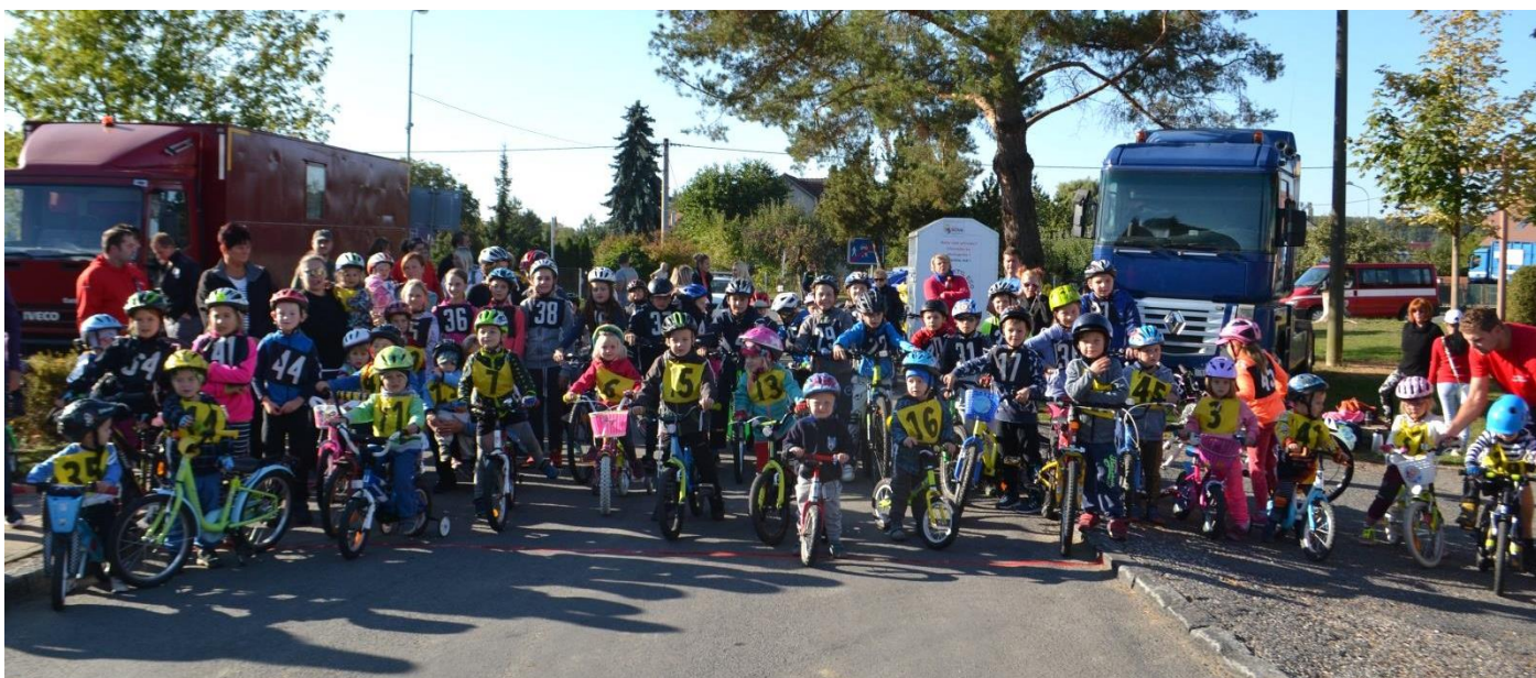
Závody na kolech, rok 2018