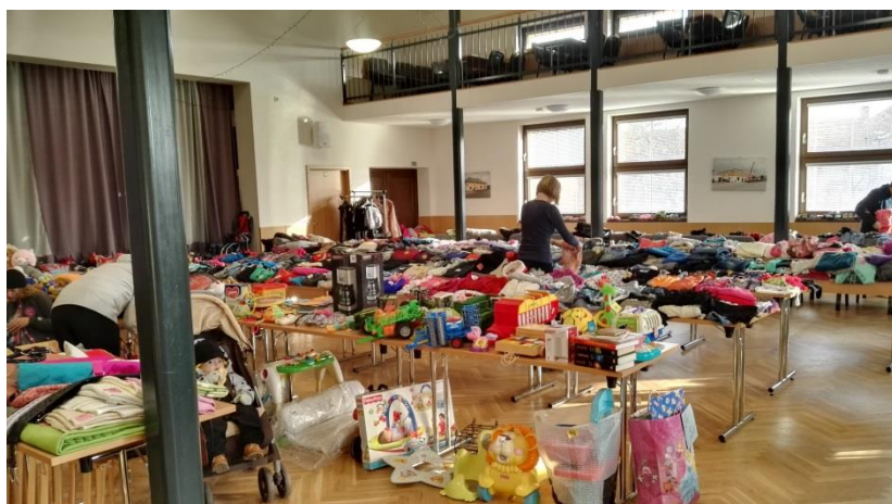
Z burzy konané na jaře 2019

Bližší informace: Blanka Jedličková (tel.: 731 758 018)